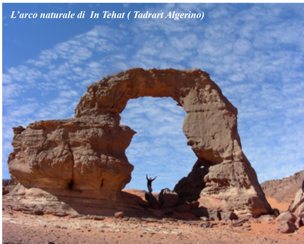
L'arco naturale di In Tehat ( Tadrart Algerino)