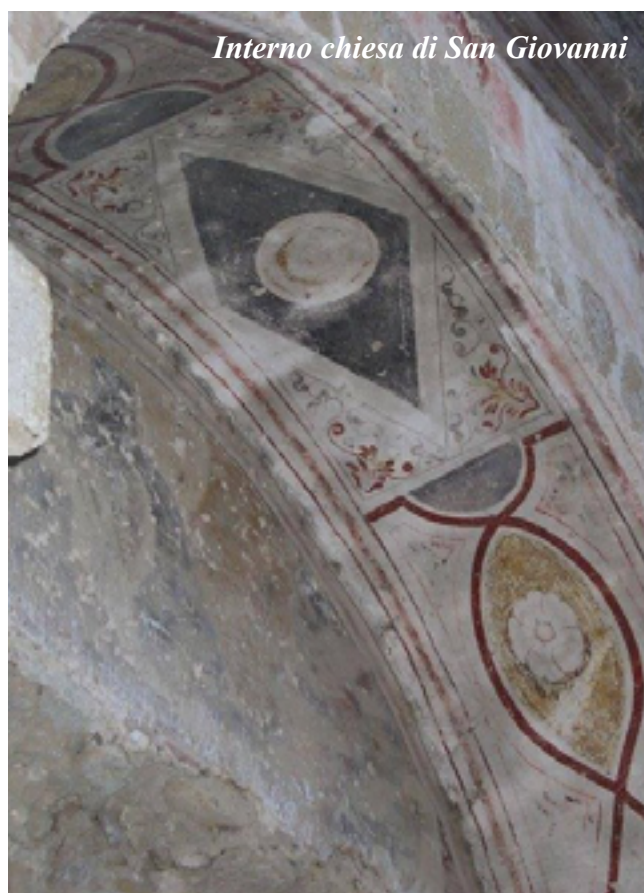
Interno chiesa di San Giovanni