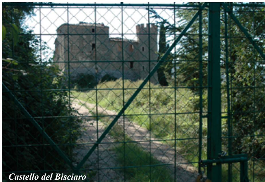
Castello del Bisciario

alla sua abitazione e qui ci attende una scoperta veramente incredibile.