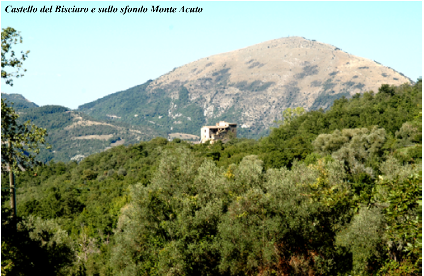
Castello del Bisciario e sullo sfondo Monte Acuto

Il panorama, in questo tratto, ci viene completamente negato da fitte rogaie, ricche di more e di rose canine che con i loro colori, violaceo e aran-