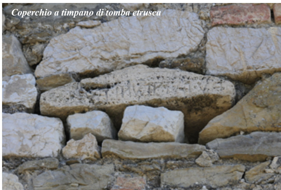
Coperchio a timpano di tomba etrusca

E' necessario stare ben attenti, la strada è stretta e