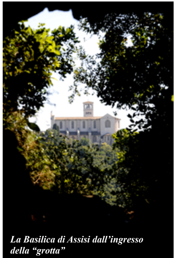
La Basilica di Assisi dall'ingresso della "grotta"