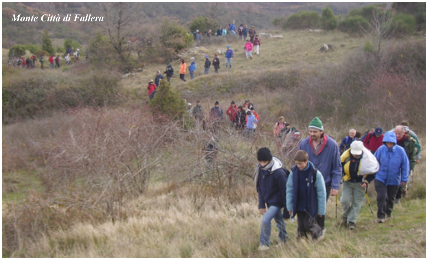
Monte Città di Fallera