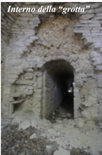
Interno della "grotta"

Anzi se lo chiediamo a Vincenzo, vi ci organizza una bella escursione!