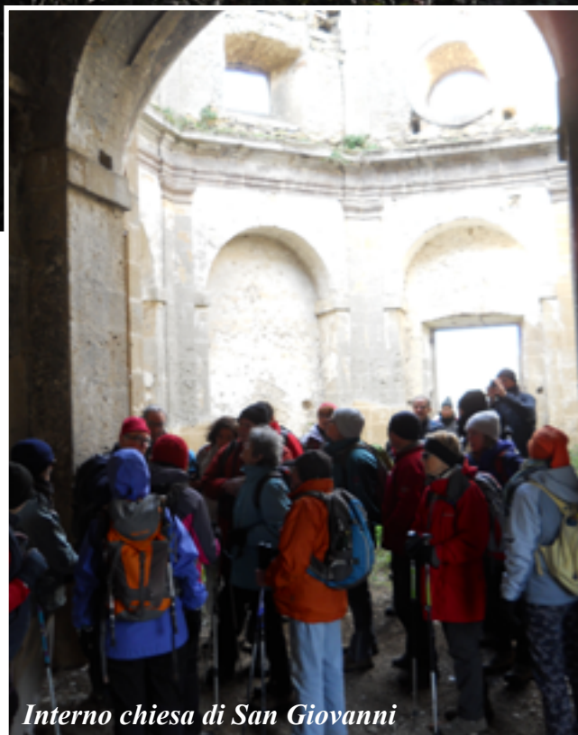
Interno chiesa di San Giovanni

“Questo insolito “mercoledì” senior, caino e gastronomico, ci porta a Gradoli, sulla costa nord-occidentale del bacino del lago di Bolsena, tra coltivi di olivi e vigneti, frammisti a lembi di cerreta quaternaria, su sentieri battuti anche dai briganti ottocenteschi. È una “sgambata” adatta a tutte le età, a contatto di una realtà agricola e gastronomica tradizionale, in un ambiente ricco di suggestivi scorci sul lago. Gradoli – il nome si fa risalire al latino gradus per via della posizione pronunciata – è dominato dall’imponente palazzo Farnese. Tra i prodotti di questa terra vanno ricordati l’Aleatico DOC, i fagioli del Purgatorio e l’ottimo olio extravergine d’oliva”.