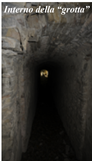
Interno della "grotta"