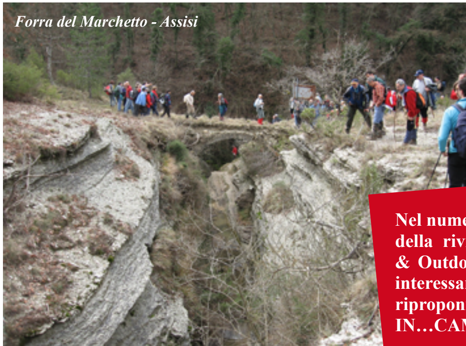
Forra del Marchetto - Assisi

Nel numero dei primi di marzo della rivista online "TREKKING & Outdoor" abbiamo letto questo interessante articolo che riproponiamo in questo numero di IN...CAMMINO.