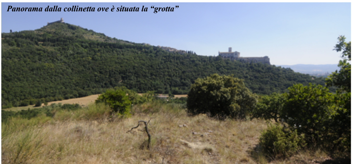
Panorama dalla collinetta ove è situata la "grotta"