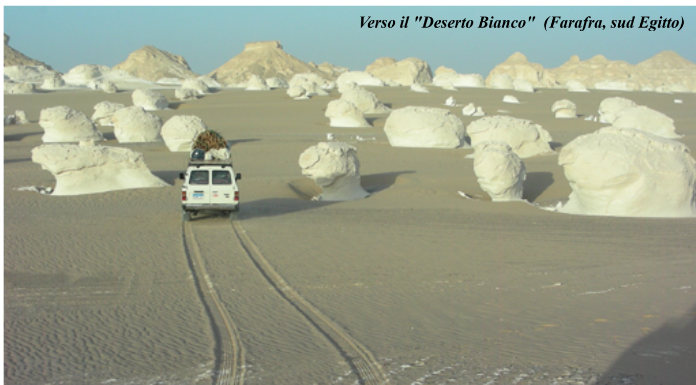
Verso il "Deserto Bianco" (Farafra, sud Egitto)

itinerari di guerra tra trincee e gallerie, lungo le strade degli alpini o linee strategiche di difesa ecc. Ma anche sul tema del lavoro: sentieri dei carbonai, dei minatori, delle transumanze o delle pecore