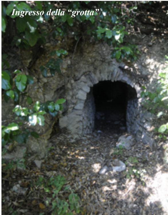
Ingresso della "grotta"

Ma voi, per caso, avete mai sentito parlare della storia della "grotta del Cinicchia"?