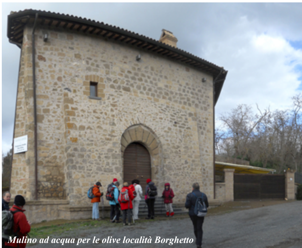
Mulino ad acqua per le olive località Borghetto

Alberto da Sangallo. Il gruppo ha notato quanto la voracità e l'incuria delle persone possano distruggere un piccolo capolavoro di importanza storica e architettonica per le popolazioni confinanti con le rive del lago di Bolsena.