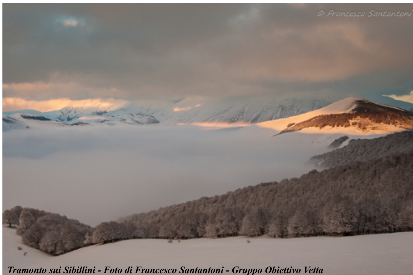
Tramonto sui Sibillini - Foto di Francesco Santantoni - Gruppo Obiettivo Vetta

Luciana Fiorini Granieri (in: “fogli come foglie”, Editoriale Umbra2007)