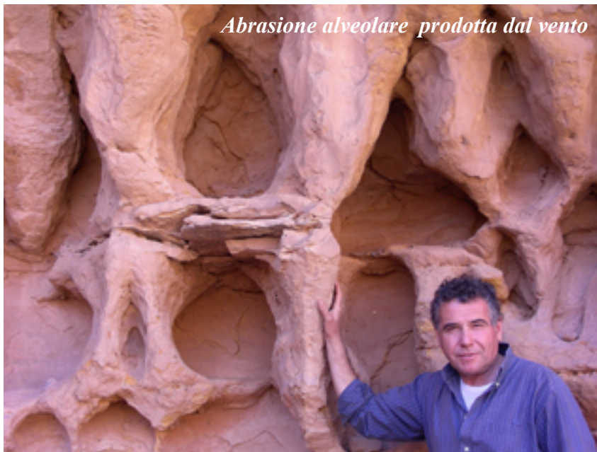
Abrasionne alveolare prodotta dal vento

Tutti siamo d'accordo che camminare è bello, appagante, salutare, ... perché fa parte della natura dell'uomo. Si parla moltissimo di cime, vallate, laghi, ghiacciai, foreste, campi base, di percorsi ad anello, traversate, arrampicate. E poi c'è il tema, il filo conduttore e direi talvolta il pretesto per sviluppare certi itinerari onde valorizzare il territorio a fini turistico economici. Ecco allora le camminate archeologiche, quelle lungo dismesse ferrovie, le strade del vino, dei sapori, dell'olio. Cammini di antichi e nuovi pellegrini o briganti: via Francigena, di San Francesco, di S. Benedetto, di Santiago di Compostela, ... del Cinicchia.. Poi quelli legati a episodi storici talvolta drammatici: