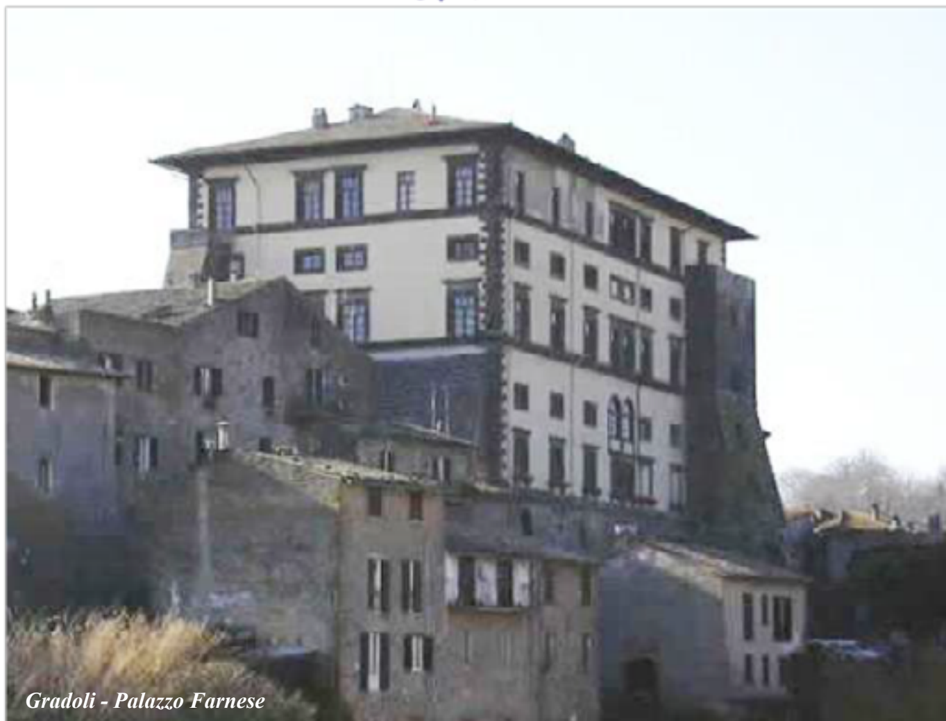
Gradoli - Palazzo Farnese

seguito il brodo di tinca con il riso, quindi il nasello fritto, il luccio in casseruola e infine il baccalà lesso condito con abbondante olio nuovo. Dopo velocissime quattro ore trascorse a tavola ci si è tuffati nei dolci che le socie avevano preparato per completare la festa. Soltanto verso le ore 18.00 la comitiva poteva riprendere il viaggio di ritorno.