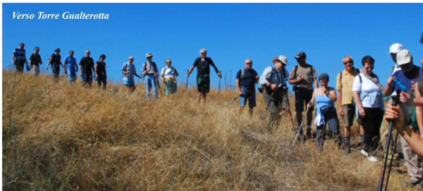
Verso Torre Gualterotta