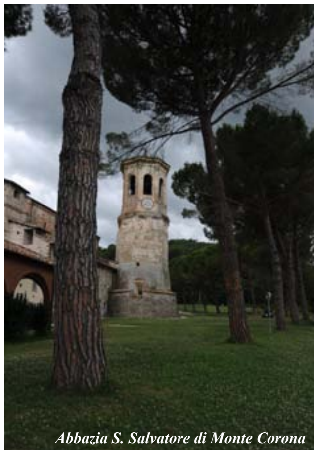
Abbazia S. Salvatore di Monte Corona

All'Abbazia S. Salvatore di Monte Corona, dove siamo attesi per il pranzo, incontriamo una trentina di amici con i quali ci riuniamo per formare un gruppo pronto ad onorare la professionalità dei cuochi.