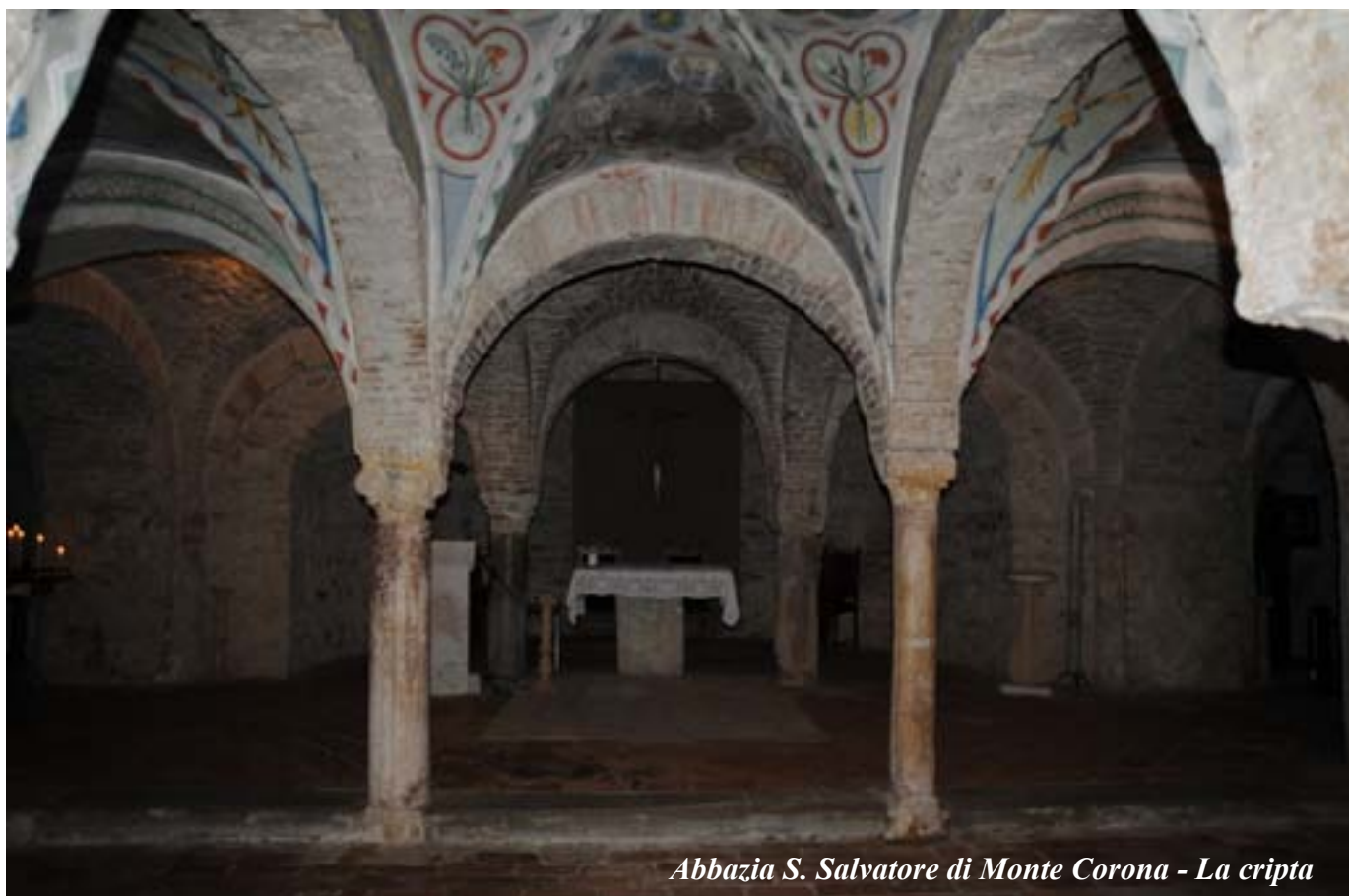
Abbazia S. Salvatore di Monte Corona - La cripta