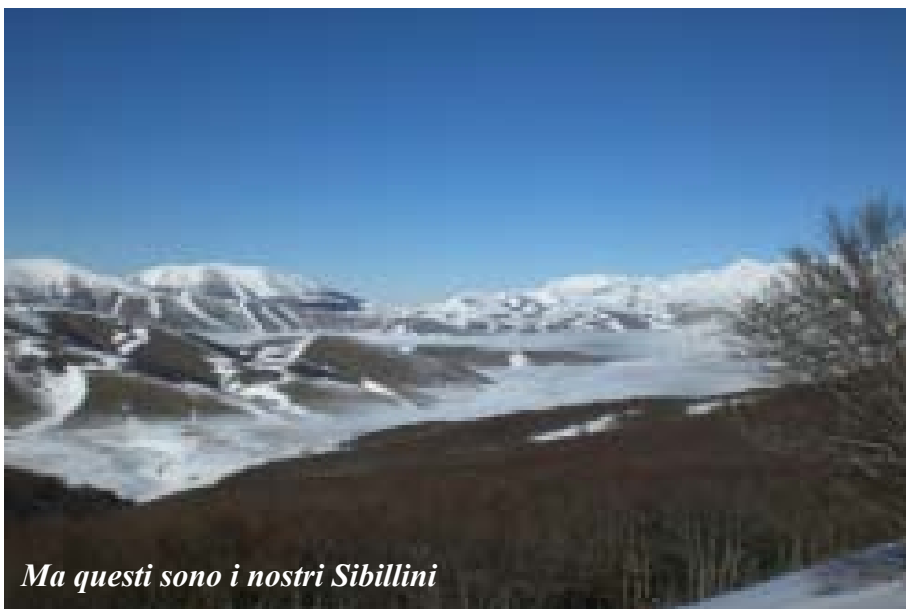
Ma questi sono i nostri Sibillini