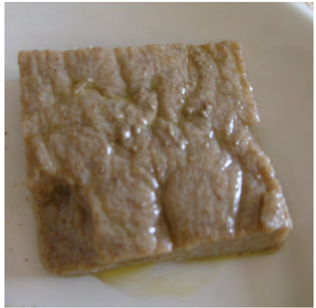
polenta di roveja

NB: da pochissimi anni la roveja è Presidio Slow Food per la Biodiversità!