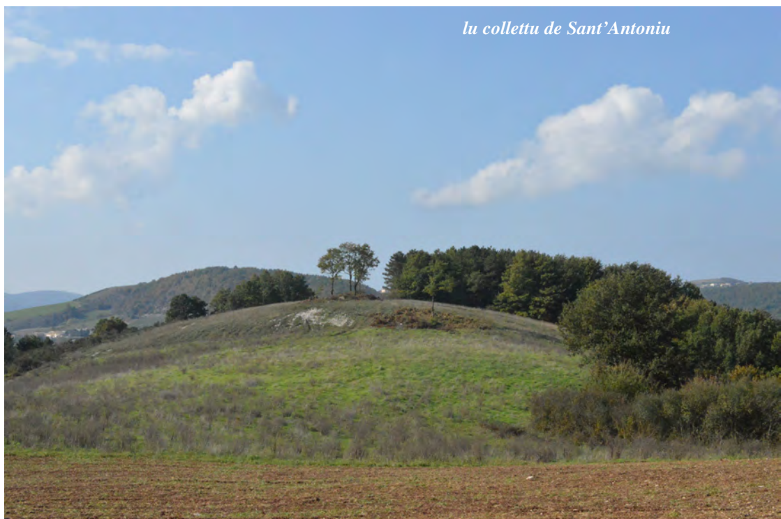
lu collettu de Sant'Antoniu

L'escursione ricalca, ma in maniera più ampia,