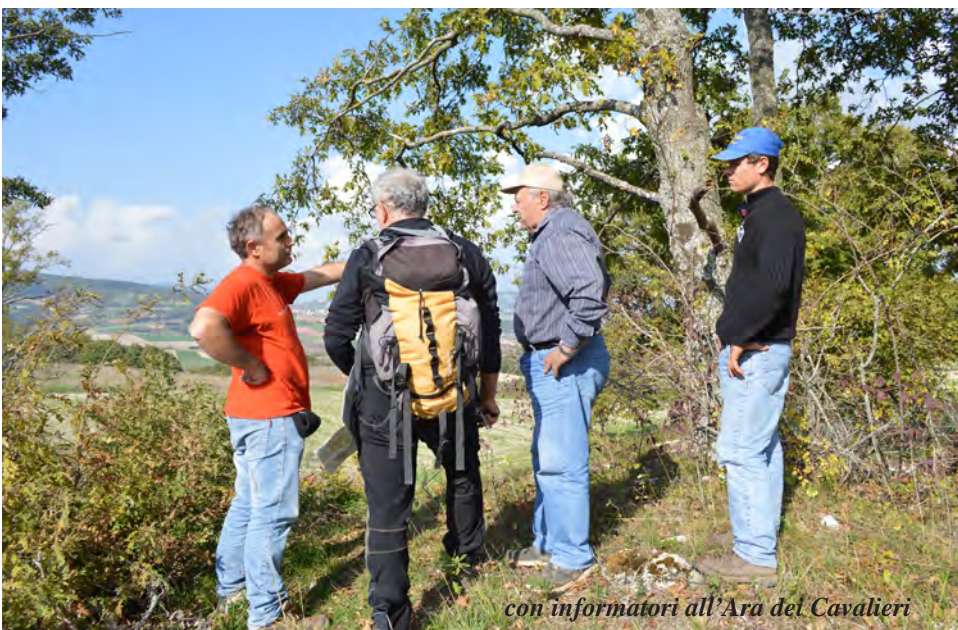
con informatori all’Ara del Cavalieri

Ritorniamo al valico e giriamo a ovest per salire al Trella, il monte ( mons Trelle / sasso de Trelle ), ove “c’era una croce di legno dove si andava il