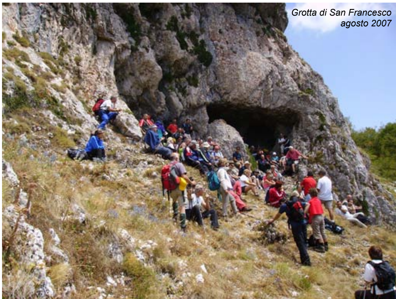
Grotta di San Francesco agosto 2007