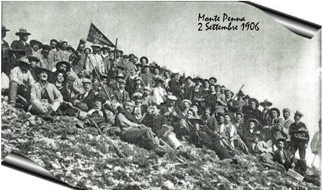
Monte Penna 2 Settembre 1906