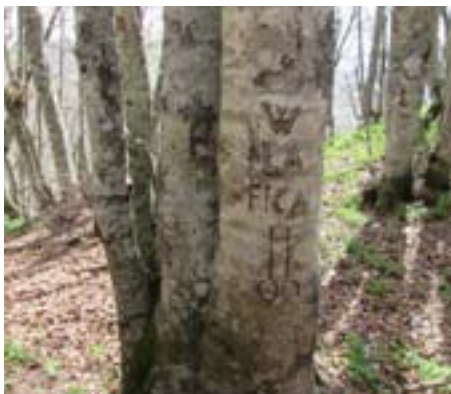
Il ceppo per gli atei

il suo desiderio di incontrare (lasciò?) un'altra persona altrettanto disponibile.