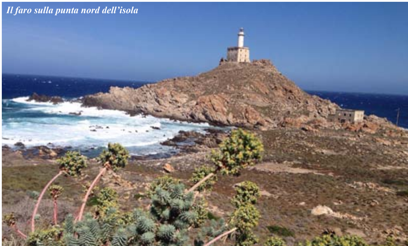
Il faro sulla punta nord dell'isola

una bella nuotata in un piccola baia protetta dal vento mentre intorno le onde impazzano sulle scogliere.