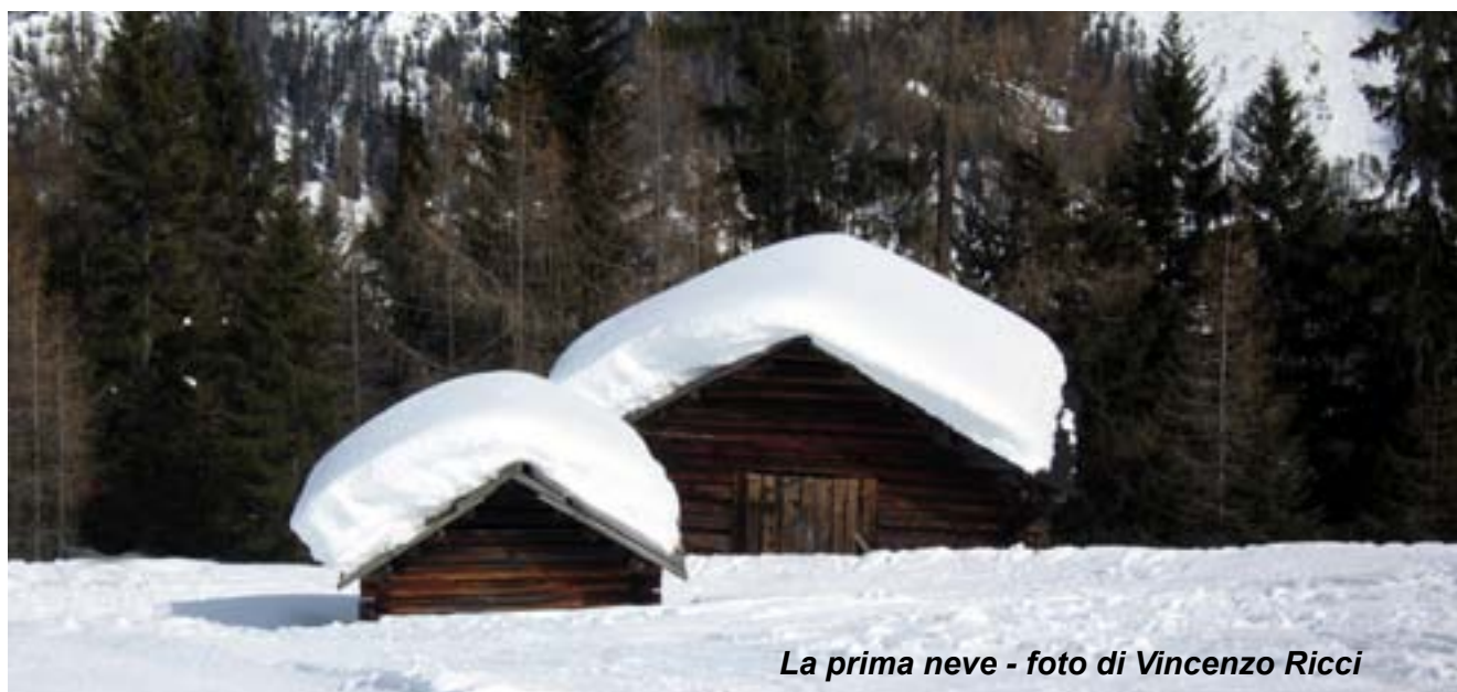
La prima neve

La preghiera è stare in silenzio in bosco. (Mario Rigoni Stern)