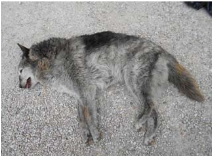
Carcassa di lupo pervenuta nel recentissimo passato all'Istituto Zooprofilattico di Perugia "Togo Rosati"

Il ricorso alle reti (Internet per intenderci), come ormai si usa fare (sin troppo spesso, temo), può offrire ulteriori e sempre aggiornate informazioni su tale tematica ambientale.