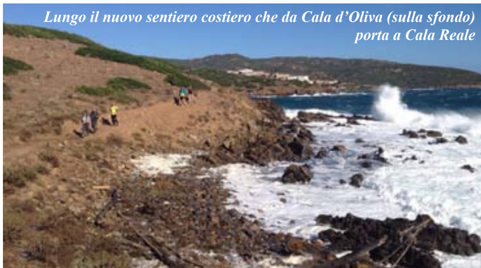
Lungo il nuovo sentiero costiero che da Cala d'Oliva (sulla sfondo) porta a Cala Reale

ritorno avviene per un'altra via attraverso insediamenti abbandonati di antichi allevamenti dove le abitazioni sono in rovina ma i muretti a secco reggono ancora perfettamente. Durante la giornata non sono mancati avvistamenti di vari animali, dagli asinelli (compresi quelli bianchi) ai cinghiali, dalle capre ai mufloni. E alla fine, tornati al mare,