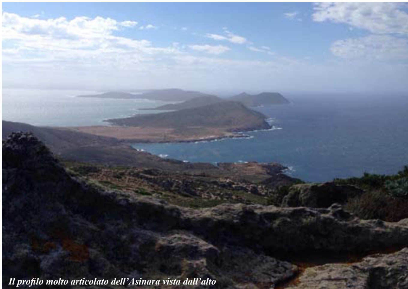
Il profilo molto articolato dell'Asinara vista dall'alto