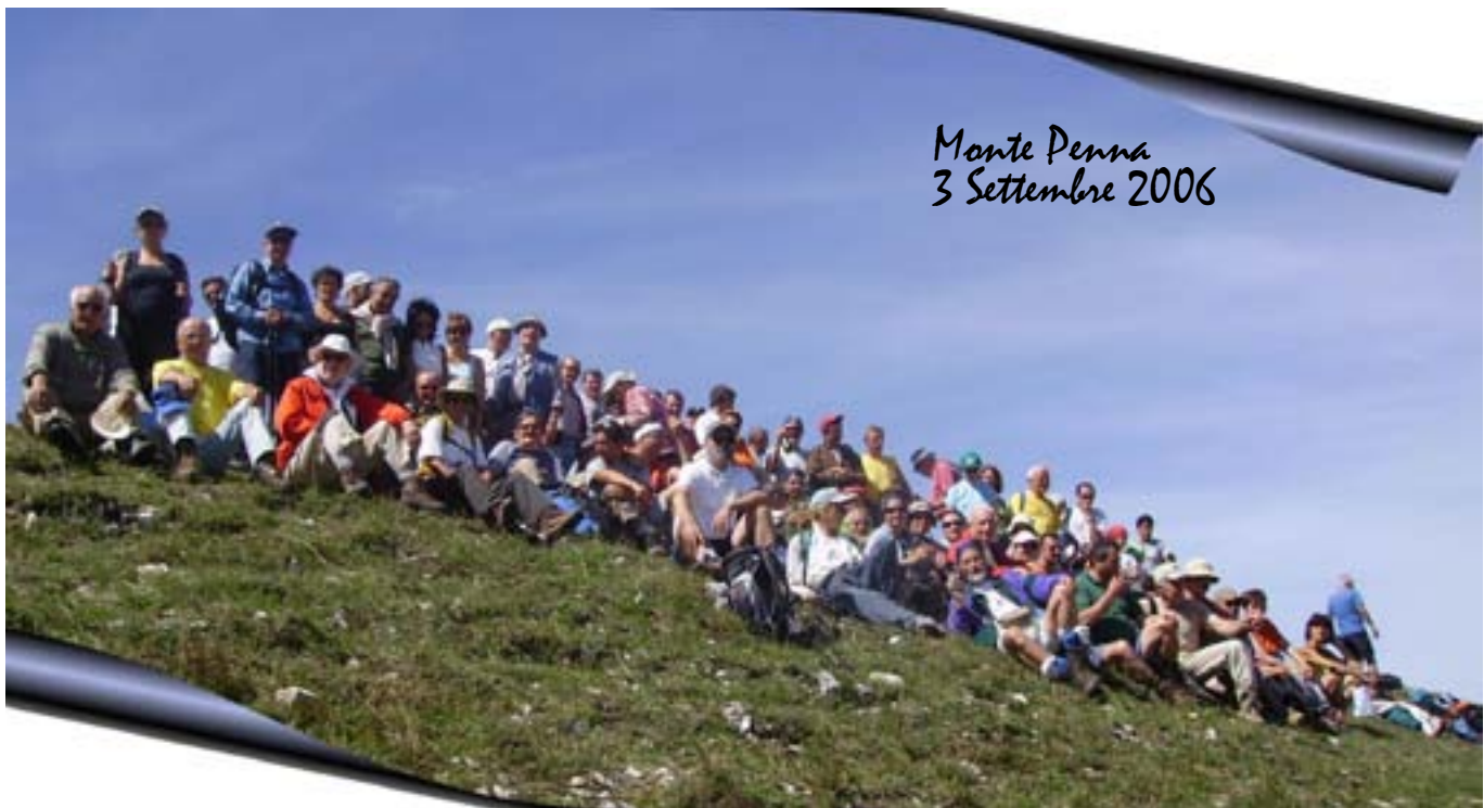
Monte Penna 3 Settembre 2006