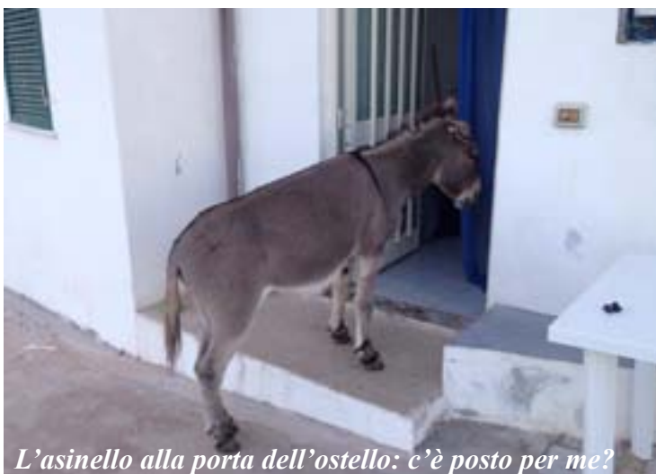
L'asinello alla porta dell'ostello: c'è posto per me?

Il ritorno per la stessa via (alla fine saranno oltre 19 i km percorsi anche se con un dislivello quasi nullo) con qualche preoccupazione: domani si partirà oppure il traghetto rimarrà bloccato per il maltempo? Fortunatamente, come da previsioni, il vento cala e alla mattina, caricati alla grande in 12 su un pullmino da 8, ci avviamo al porto per ritornare verso la Sardegna e poi il volo verso Roma e in auto a Perugia. Non senza una sorta di malinconia per dover lasciare un posto così affascinante.