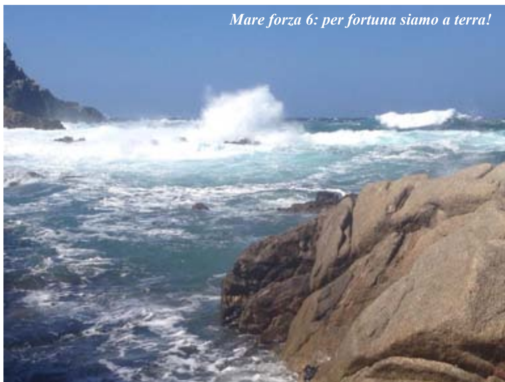
Mare forza 6: per fortuna siamo a terra!