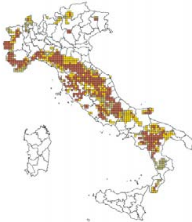
Figura 2. Distribuzione del lupo in Italia nel 2015, ottenuta dalla combinazione e integrazione di dati di varia natura forniti da oltre 150 esperti (marrone = presenza permanente; giallo = presenza sporadica, verde = dati provenienti dalla mappa in Fig. 1 e non aggiornati)

hanno assalito uccidendo molti capi di bestiame, in particolare bovini ed equini.