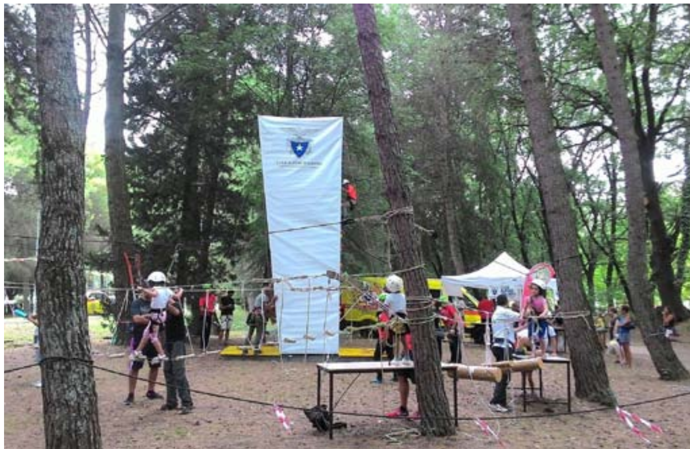
Ci si cimenta su tronchi mobili e ponte tibetano Assistenza e sicurezza per tutti