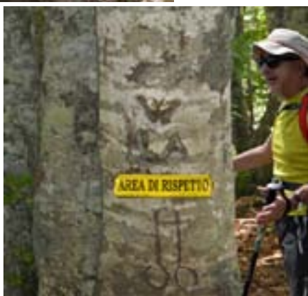
Il ceppo per i puritani

Ma come commentare un manifesto così esplicito?